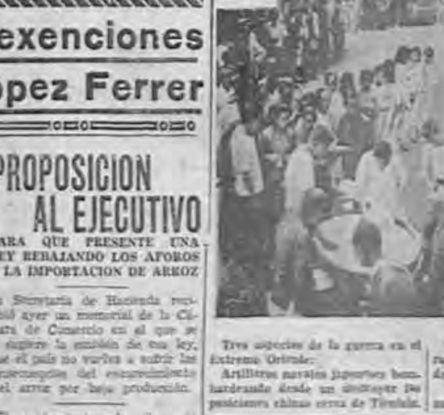
Centros de aprovisionamiento para la población civil en el norte de China. Y tropas japonesas listas para tomar su brío en Tientsin.

El señor secretario de Fomento formulo ayer el último reajuste del presupuesto de su cartera para el próximo año. Se precisa introducir algunas modificaciones en los proyectos formulados por distintos jefes de departamentos. DE HOY A MAÑANA IRA EL PROYECTO A MANOS DEL SE. SECRETARIO DE HACIENDA