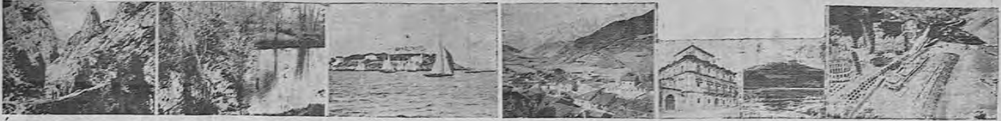
Varios rincones y vistas panorámicas de la ciudad de Santander, de cuya captura por parte de las fuerzas dirigidas por Dávila, dan cuenta los cablegramas y radiogramas que ofrecemos en esta misma edición.